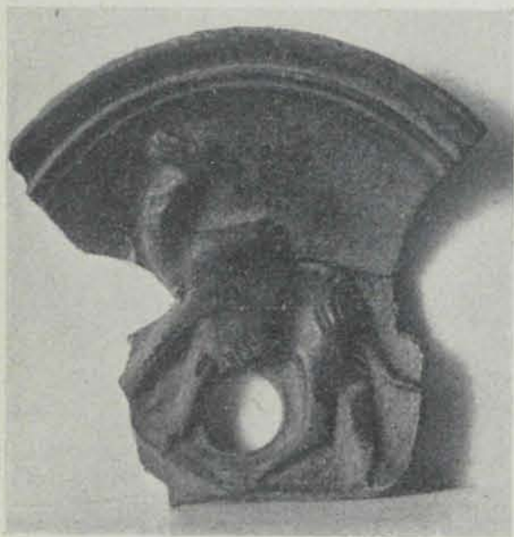
Fig. 9.- Fragment ceràmich trobat a Ibiça. (Museu de Barcelona).

D. A. Romàn fa explorar la necròpolis d'Ereso y ab lo que troba allí y lo que ha sortit de la marina de les Monjes y altres llocs d'Ibiça, publica un llibre de làmines vi-rolades: Los nombres é importancia arqueológica de las islas Pytiusas (3). Hi falta un plan