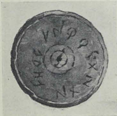
Fig. 13. - Pedra ab inscripció trobada a Empuries. Colecció de D. Rosendo Pi, de La Escala.

està decidit a continuar les excavacions y 's proposa ara explorar la part N. del turó de Puig Castellar. Aquesta vessant N. de la muntanya du senyals de paret marcant cases y carrers qu'encara no han sigut desembrassats de les terres. A les primeres paletades n'ha sortit ceràmica àtica pintada ab figures blanques, que no s'havia trobat a la vessant S., aont la ceràmica grega es uniformement negra.