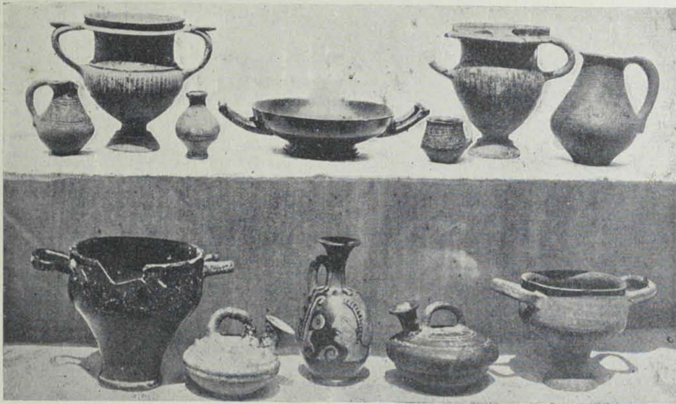
Fig. 12. - Vasos grecs y italiotes de la col·lecció Rubio de la Serna. Els 1, 5 y 7 de la línia superior són més antics.

taró, ara que coneixem el nou poblat de Puig Castellar. Mentre l'una estació 'ns presenta una necròpolis, l'altre 'ns dóna la planta de les habitacions. El senyor Sagarra