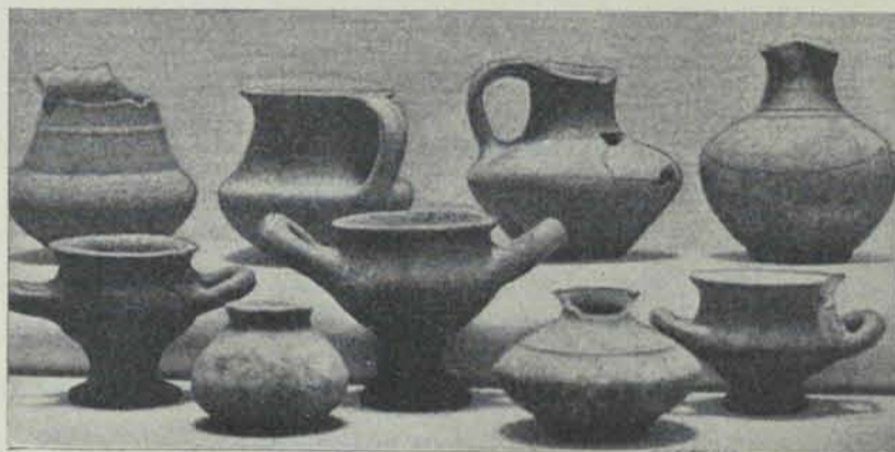
Ceràmica indígena llisa de Puig Castellar.