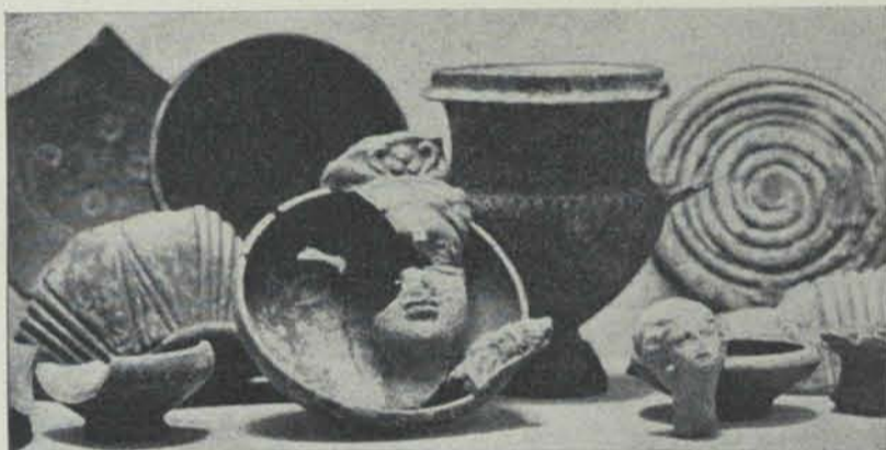
Fig. 10. - Ceràmica grega de Puig Castellar.